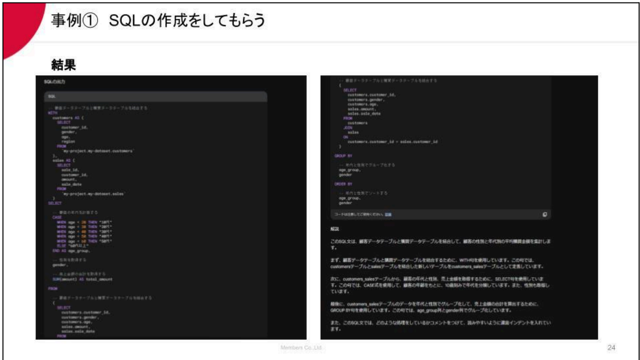
【図1】生成AI活用事例（一部抜粋）